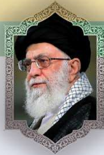
آية الله العظمى السيد الخامني دام ظله الشريف

دور المرأة في محضنة الحسين عليه السلام: ٥٧