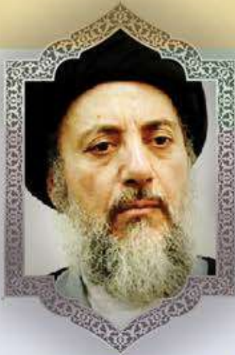
شهيد المحراب آية الله العظمى السيد محمد باقر الحكيم قدس سره

المفردة الرابعة : وهي قضية الأمل والمستقبل، وبأن النصر والعاقبة سوف يكون لهذه النهضة الحسينية، وهذا ما أكدت عليه العقيلة زينب عليها السلام في خطابها مع يزيد، حيث تقول: (( ... فكذ كيدك واسع سعيك، وناصر جهدك، فوالله لا تمحو ذكرنا، ولا تميت وحيننا، ولا تدرك أمدنا، ولا ترحض عنك عارها، وهل رأيك إلا فند، وأيامك إلا عدد، وجمعك إلا بدد، يوم يناد المناادي ألا لعنة الله على الظالمين). فبالرغم من الظروف الصعبة التي كانت تعيشها عليها السلام، والتي لا يمكن إلا أن تعبر عن قمة المأساة فيها، وما مر عليها من قتل أهل بيتها إلى سبيها وأسرها وذلها، وغير ذلك. نجدها بهذه القوة والصلابة، تؤكد بأن النصر سوف يكون حليفاً لنا، مهما كانت الظروف، وما صنع الله بنا إلا خيراً، والنتائج دائماً إلى صالحنا، وسوف يكون المستقبل إلى جانبنا. فالقضية الروحية المعنوية في العملية السياسية والجهادية مهمة جداً، والإعلام هو : الذي يمكن أن يرسم المصير.